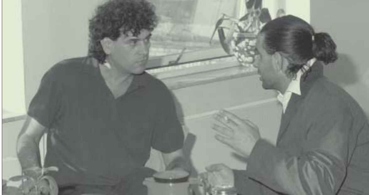
I gennemsnit kommer mellem 45 og 50 besøgende i Mødestedet, der har åbent mandag-torsdag.