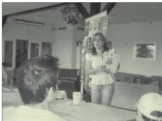
Børnene undervises også om Armeniens historie, hvor kristendommen blev statsreligion i 301.