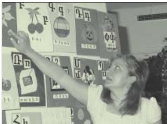
Det armenske alfabet, der har 39 bogstaver, stammer tilbage fra begyndelsen af 400-tallet.