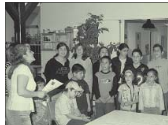
Børnene lærer også armenske sange, som de synger med stor glæde.